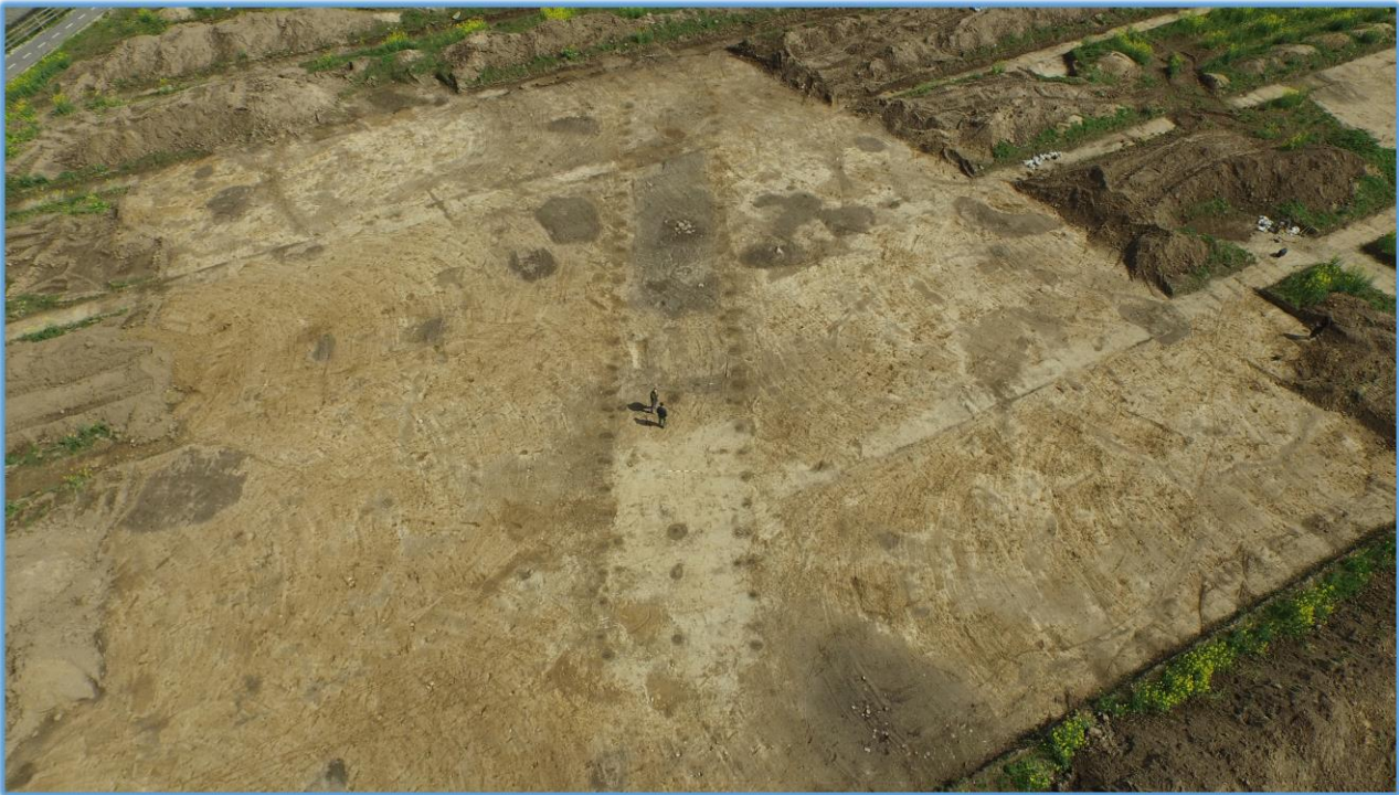
Monumentalt midsulehus fra omkring 2000 f.Kr. Udgravet i Vinge sydøst for Frederikssund.

kandinavien. Denne reneolitisering må dermed forstås som en vigtig brik i udviklingen hen imod den enhedskultur, der kom til at præge området i den efterfølgende periode, bronzealderen. Foredraget tager afsæt i phd-afhandlingen “Reneolithisation – subsistence and change in Late Neolithic Southern Scandinavia.”