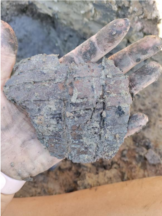
Figur 2 - Keramik fundet ved forundersøgelserne til Energiø Bornholm